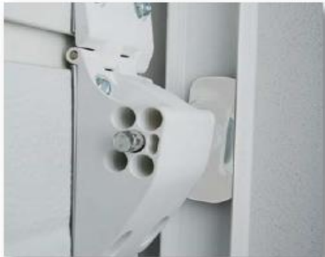
Cerniera laterale con posizionamento rapido

④ Nuova cerniera laterale brevettata con posizionamento rapido della ruota di scorrimento; scegliendo il foro più adatto tra i 5 presenti sul carrello, si ottiene un abbattimento notevole dei tempi di montaggio; la profondità minima impedisce che ci si possa inopportunosamente "arrampicare"; previste nello standard le protezioni antischiacciamento delle dita su tutti i rulli di scorrimento.