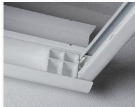
Inserito angolare per dima

⑨ Inserito angolare per il fissaggio a incastro della dima posteriore con le guide orizzontali; evita le operazioni di foratura e di montaggio delle viti, essendo inserito a pressione; migliora l'estetica, non essendo visibile a montaggio completato.