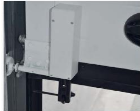
Fotocellula di sicurezza TSD

⑥ Nuova ed esclusiva fotocellula di sicurezza. Viene installata nella parte interna della porta sezionale, in grado di arrestare ed invertire la corsa della porta PRIMA DELL'IMPATTO CON L'OSTACOLO.