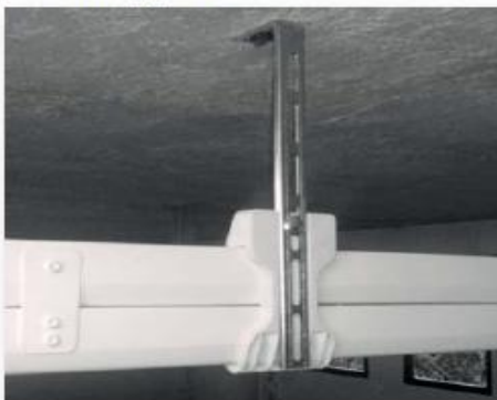
Staffe fissaggio a soffitto

⑧ Staffe di fissaggio a soffitto, che facilitano l'operazione di montaggio e garantiscono qualità e durata sotto sforzo.